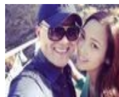
Б.Амархүүгийн О.Ариунзулд бэлэглэх сая дах са