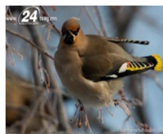
Саарал ордноос Сонгины булан руу "дүрвэгсэд"