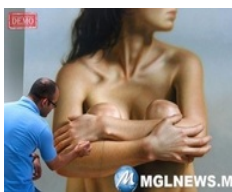
Итгэмээргүй бодит зураг