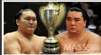
Хэнийх нь цом бэ