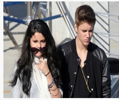
Жастин Бибер Их Британид төвхнөнө