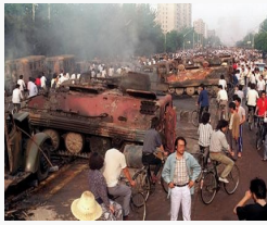
Хятадын тагнуулчдын дотооддоо явуулдаг ажиллагаа