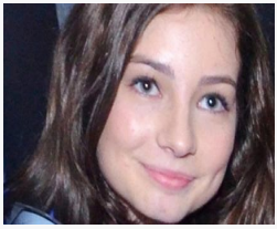
Пол Уокерын охин эмээтэйгээ үзэлцэнэ