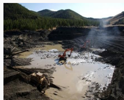
Манай улс уул уурхай,