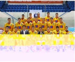
Монголын хоккейчид хүрэл медаль хүртлээ