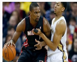
Крис Бош ууртай байна