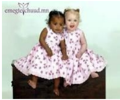
Дэлхийн хамгийн сонирхолтой төрөлтүүд