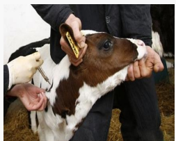
Хятад вакцин тарьсан мал