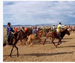
Уяачид зовлон жаргалаа хүүрнэв