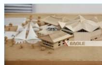
Монголын эмэгтэй архитекторууд "Хос жигүүр"-т