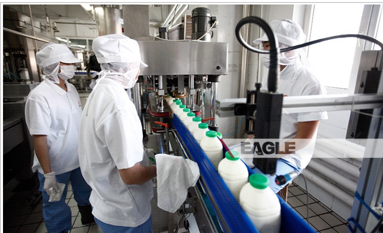
- Савлагдаад бэлэн болсон тарганд энэхүү төхөөрөмж үйлдвэрлэсэн он сарыг нь автоматаар дарна -