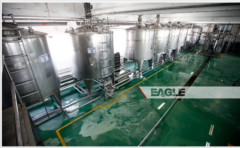
- Тараг энэхүү танкинд бүрэлдээд тусгай хоолойгоор цааш дамжин савлагдана -