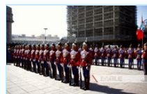
"Эх орон Тусгаар тогтнолын эзэд" ёслолын арга хэмжээ боллоо