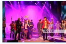
Орчин цагт өрнөсөн "Бремен хотын хөгжимчид"-ийн түүх