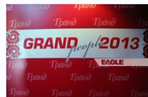
"Grand People 2013" шилдгүүдээ нэрлэлээ