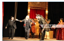
Ноён Жуаны эмгэнэлт төгсгөл