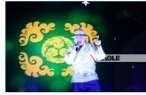
Т.Дэлгэрмөрөн "Гэрэлт үзэсгэлэн гоо"-г дэлгэлээ