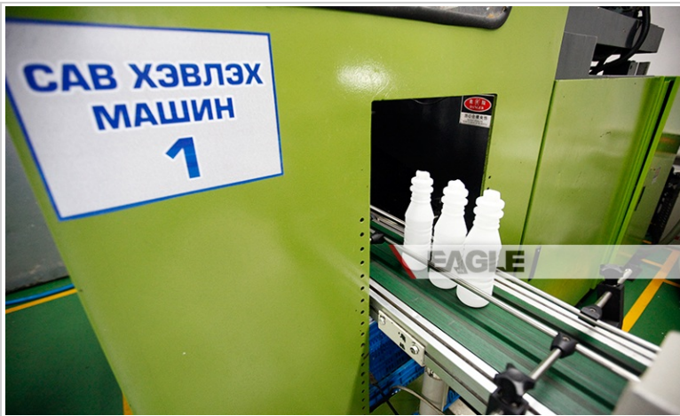
- Тарагныхаа савыг өөрсдөө үйлдвэрлэдэг -