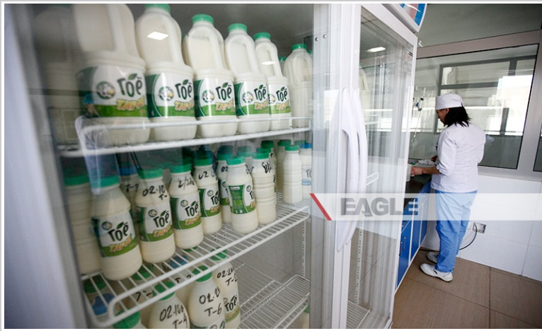
- Танк бүрээс авсан тарагны дээж -