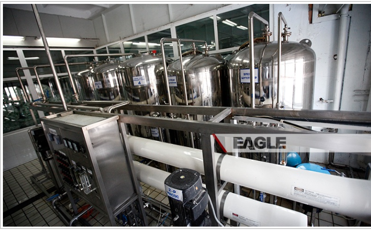
- Тараг бүрэх, сүү авах, тараг савлах тоног төхөөрөмжүүдийг хүчил шүлт, цэвэршүүлсэн ус зэрэг таван давхар шүүлтүүрээр ариутгадаг -