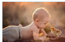
Сонирхолтой гэрэл зургууд